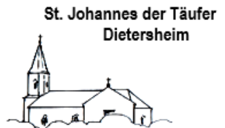
St. Johannes der Täufer Dietersheim

Kirchenanzeiger der katholischen Pfarrei St. Andreas – Eching mit Filiale St. Johannes der Täufer - Dietersheim