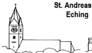
St. Andreas Eching