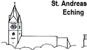
St. Andreas Eching