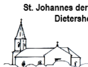
St. Johannes der Täufer Dietersheim